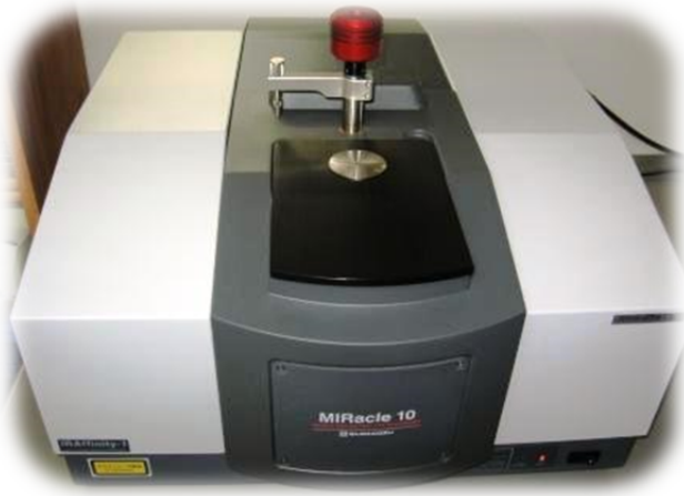
島津製作所 FT-IR IRAffinity-1